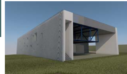
MIK • NOÉ

2016.06-2017.06 Nyitóprojektek megvalósítása